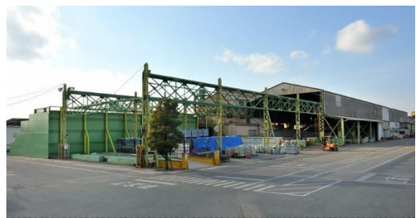
見学先のリーテム水戸工場

リサイクルは経済合理性に基づき進められるが、規格や表示方法の統一はリサイクルのし易さに影響し、リサイクル率の計算方法や統計の取り方などもリサイクルの評価に影響することから、リサイクルが促進さ