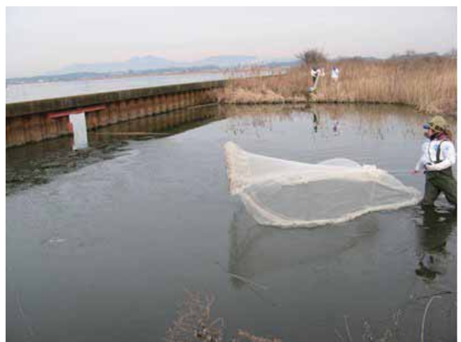
水面の半分に薄氷が張っている池での投網調査