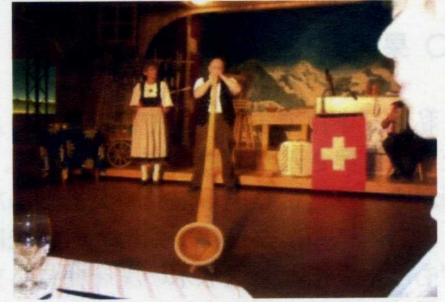
インターラーケン