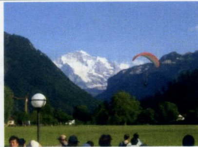
インターラーケン