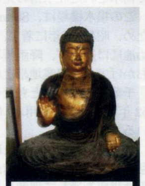
海蔵寺の阿弥陀如来坐