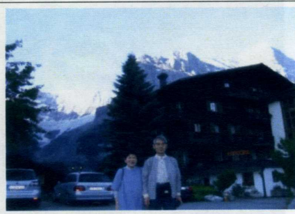
グリンデルワルトにて