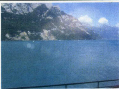
スイス ブリエンツ湖

登山家は、ここインターラーケンには宿泊せず、バスや電車で40分程のグリンデルワルトまで足を延ばし宿泊するそうです。私達もそうしました。グリンデルワルトはアイガー北壁がすぐそこに迫り、五箇山の合掌造りのようなホテルが立ち並び静かなスイスらしい雰囲気漂う町です。スイスに行ったら是非ここでこの宿泊をおすすめします。