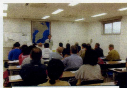
両総用水機場会議時での概要説

午後は、利根川の水を取り入れている利根川桶門を見学し、講座は終了した。私自身、身近にある設備が何をしているのかよく分からないので、このような現地講座を通して理解し、水への関心をより深めていきたいと思う。(平江)