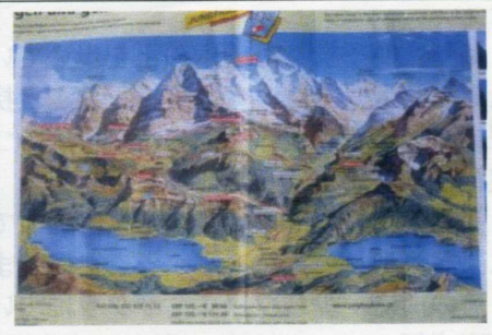
メンヒ、アイガーへの地図