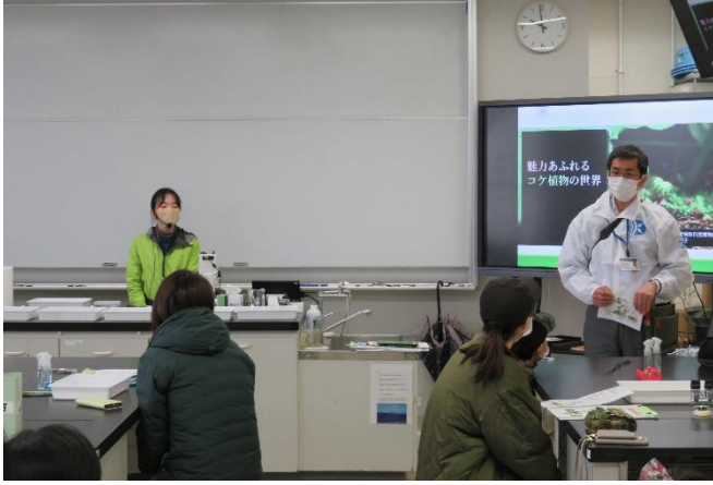
開会とオリエンテーション