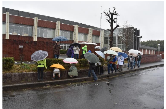
雨の中での観察（歩道付近の植え込みの下）