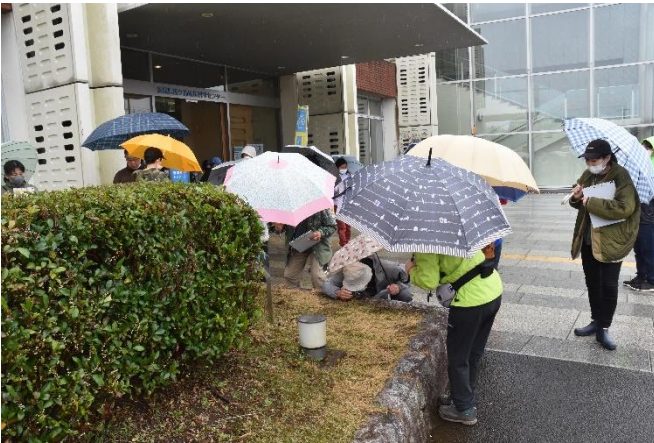
雨の中での観察（センターの建物付近）