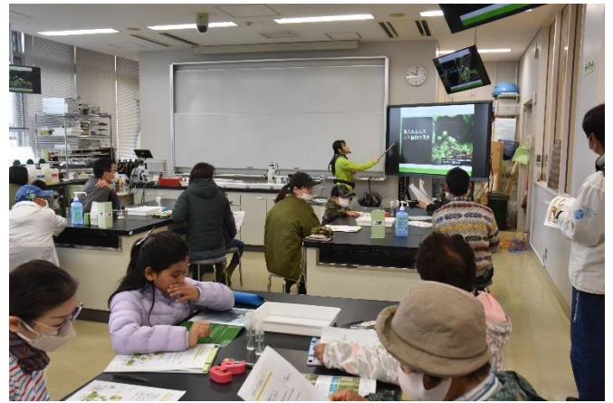
コケ植物についてのレクチャー