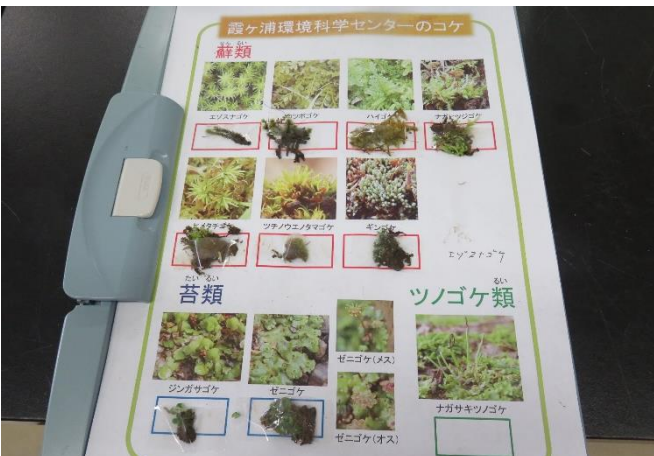
出来上がった実物のマイコケ図鑑