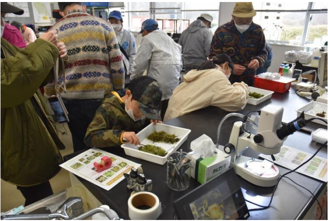
あらかじめ採集しておいたサンプルを取る作業