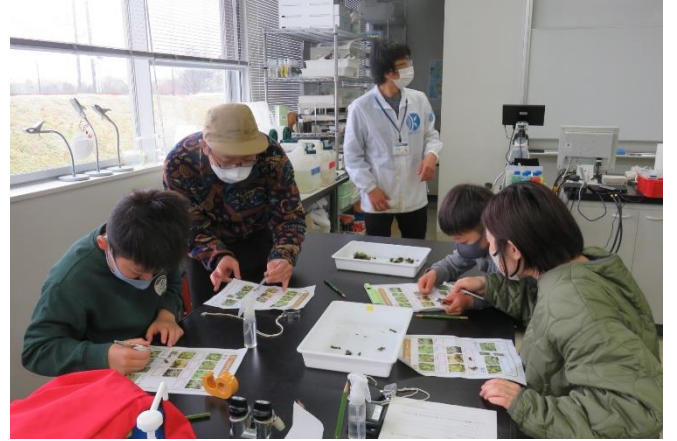
そのサンプルをプリントに張り付ける作業