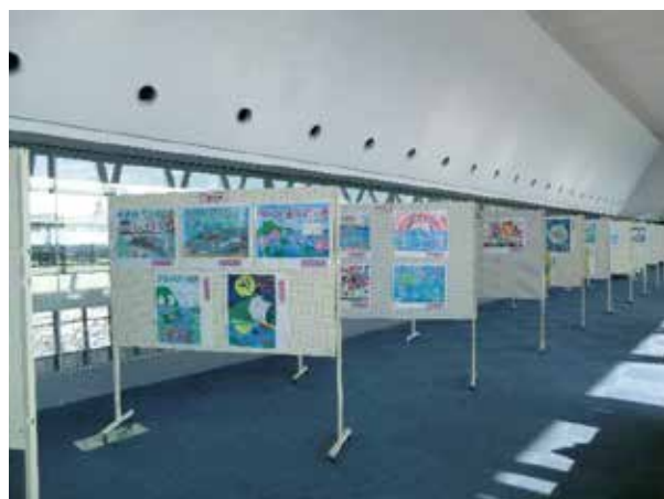
入賞作品巡回展示