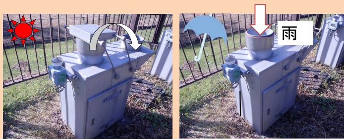
自動降水捕集装置(小笠原計器製US-330)