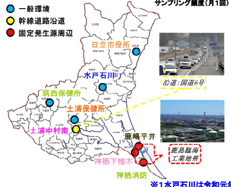
図1 調査地点 ※1水戸石川は令和元年度まで調査。