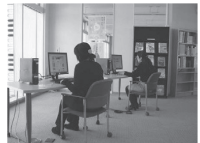
情報検索用パソコン