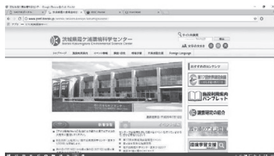
センターホームページ