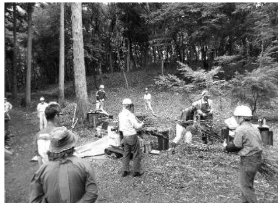
機材を活用した里山保全活動