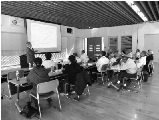
パートナー全体研修・交流会