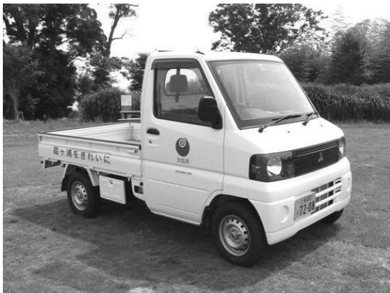
貸出機材（軽トラック）