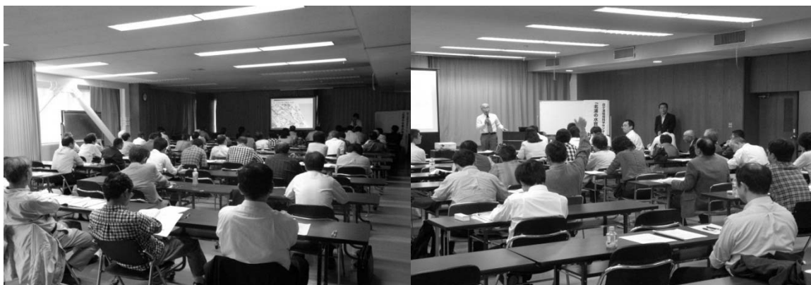
公開セミナーの様子