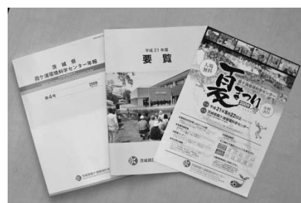
センター作成広報物