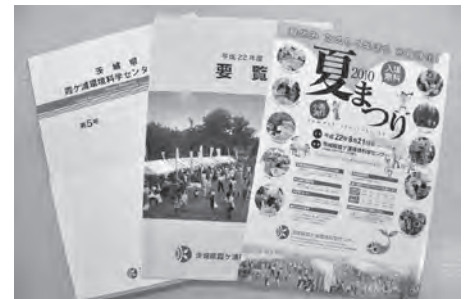
センター作成広報物