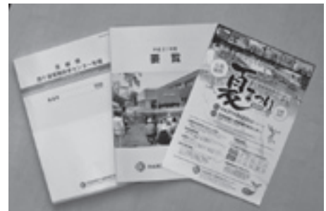
センター作成広報物