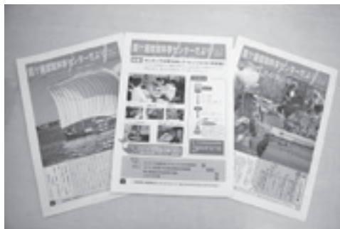
霞ヶ浦環境科学センターだより