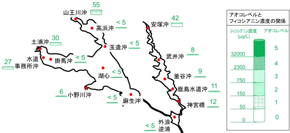
図1 フィコシアニン濃度の分布