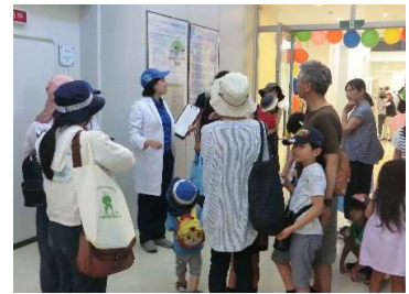
研究員が案内する研究室ツアー