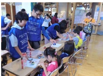
エコランタン・エコマグネットを作ろう!