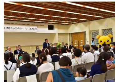
土浦市下水道促進コンクール表彰式