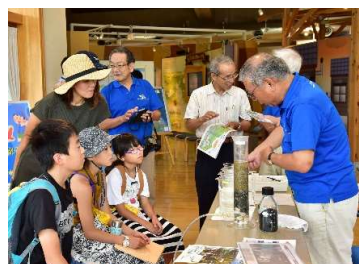
浄化の仕組みを楽しく学ぼう!