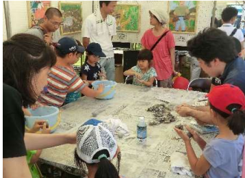
農業農村整備コーナー