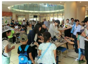
オリジナルバッジを作って酒沼を学ぼう!