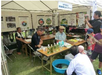
水生植物を利用した酸素発生実験