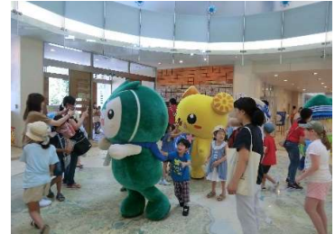
ご当地キャラクター撮影会