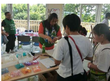
保冷剤を作って地球温暖化を考えよう!