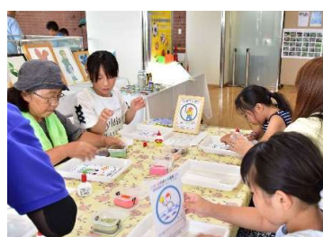
廃ガラスアートで「いきいき茨城 夢国体2019」を応援しよう