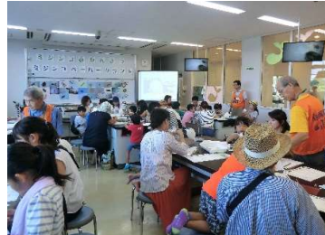
ミジンコの世界へようこそ!