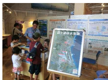
国土交通省霞ヶ浦導水工事事務所