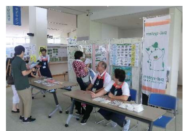
生活協同組合パルシステム茨城 栃木 環境クイズに挑戦