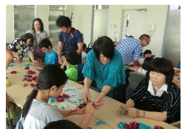
アクリルたわしづくり教室