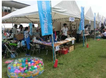
廃油利用石鹼の販売