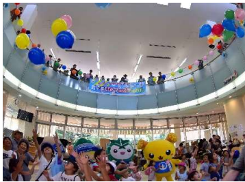
会場(エントランスホール)