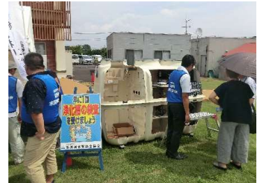
浄化槽カットモデル展示