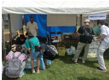
下水道の役割や下水道の知識の普及