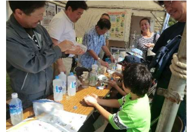
水質浄化実験, スライムづくり