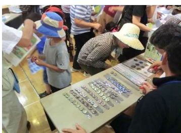
昆虫標本をつくろう