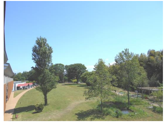
【センターは今「万緑」の季節です】