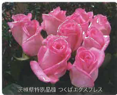
茨城県特別品種 つくばエクスプレス

東京市場 = 東京都中央卸売市場における取扱高の全国順位。 作付面積 = 作付面積の全国順位。