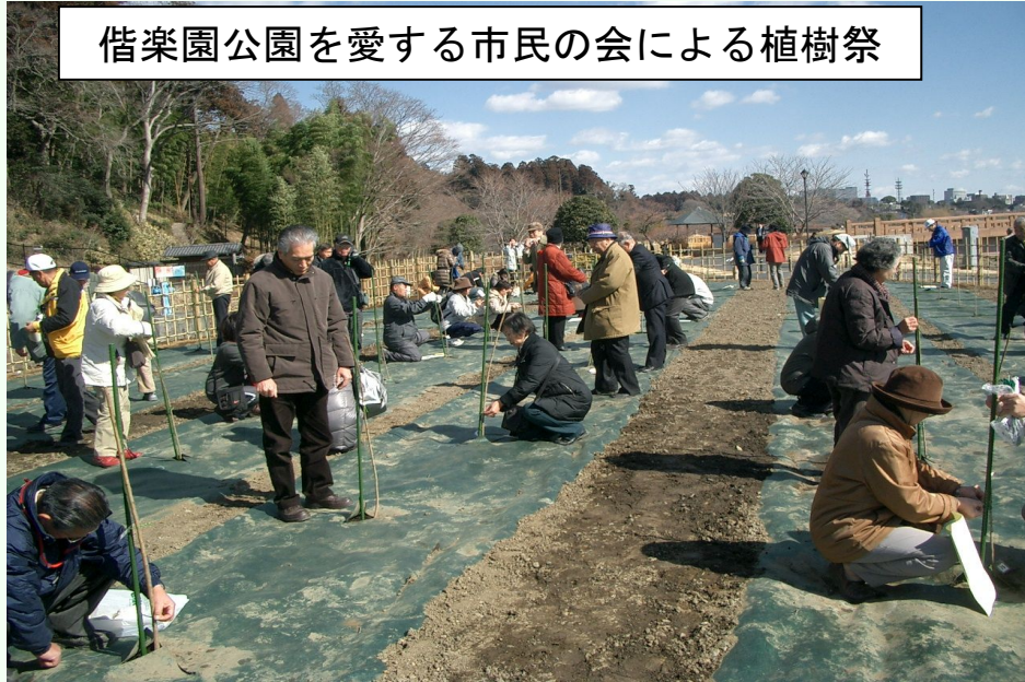
偕楽園公園を愛する市民の会による植樹祭