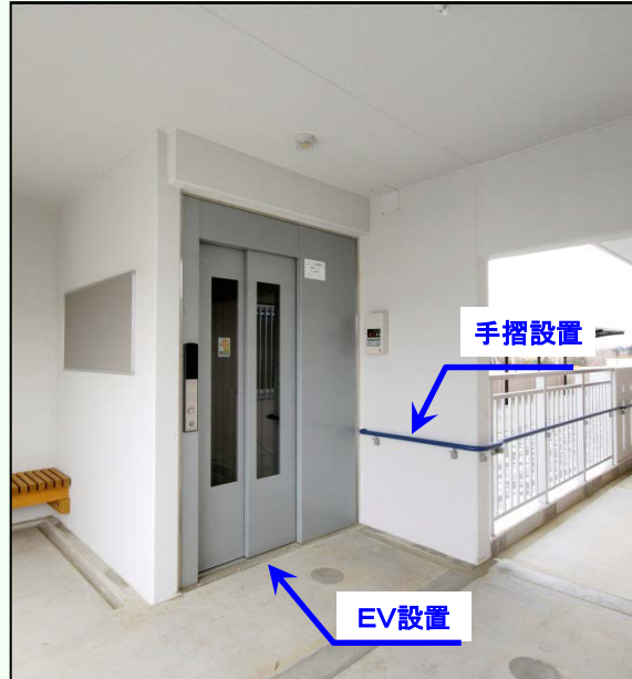
県営住宅の入居世帯区分