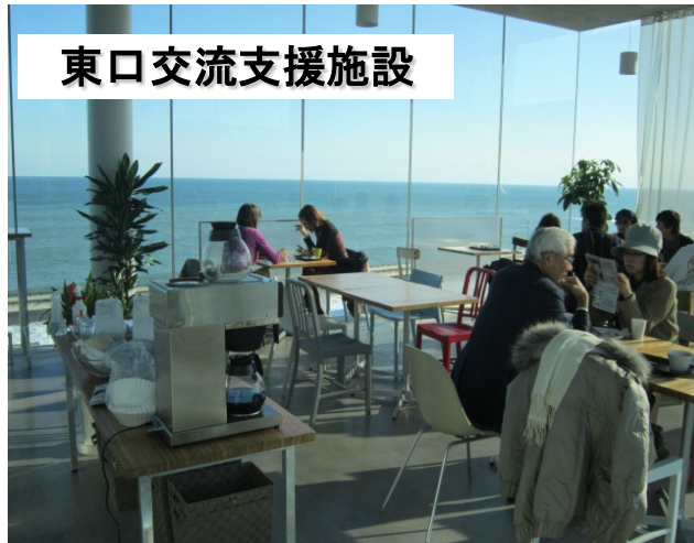
東口交流支援施設