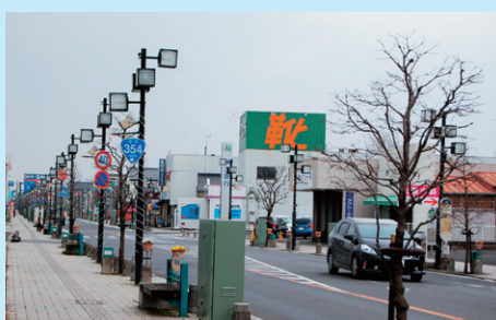
▲電線類の地中化により、上空がすっきりした商店街

岩井センターモール商店街は、中心市街地に位置し約1.4キロにわたって、「電線地中化」や「歩道整備(インターロックキングやデザイン整備)」が施されています。辺田本町線の整備によって美しい街並みが構築され、歩行者数も増加。商店街の活性化につながったといえます。来訪者からの「変わったね」という言葉に勇気づけられています。この整備に着手しなかったら現在は「シャッター街」になっていたでしょうね。とにかくすっきりとした景観が自慢の商店街。今後は観光客をにらんだ「お店づくり」を心掛けたい。