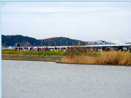
北浦大橋をくぐります。