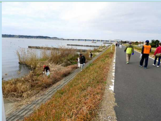
ごみを拾いながらウォーキング。