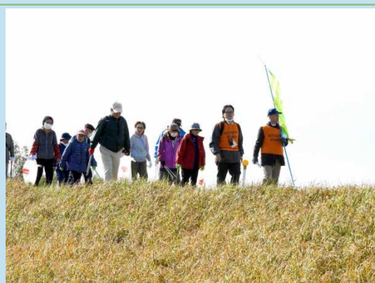
穏やかなウォーキング日和。