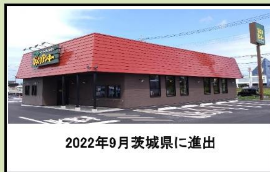
2022年9月茨城県に進出