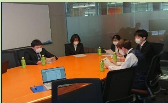
※新入社員研修(関東オフィス)