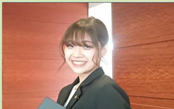
※各部署20代30代活躍中!