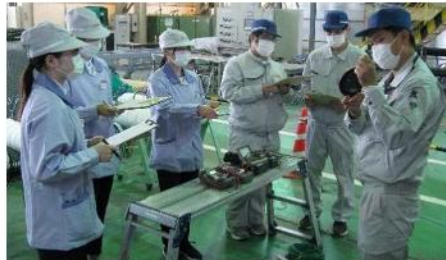
新入社員現場実習風景