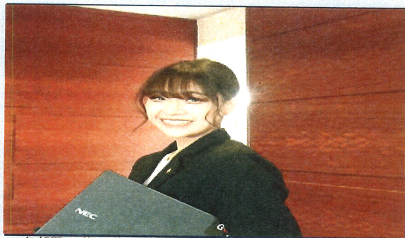
※各部署20代30代活躍中！