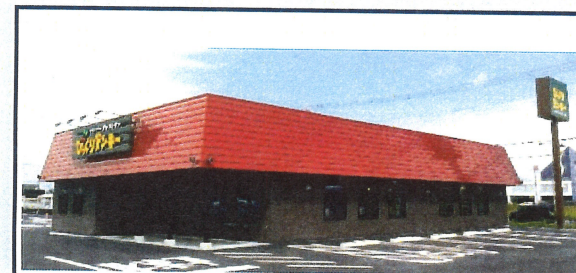
2022年9月茨城県に進出