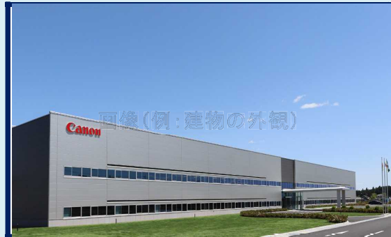
画像(例:建物の外観)

当社は最先端の金型設計・製造技術を駆使し、超精密金型を提供することで、「ものづくり」の先駆的役割と責任を果たし、世界の産業界に貢献しています。