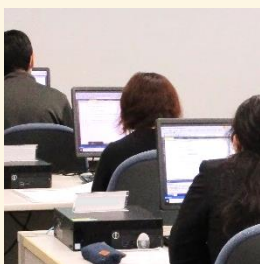
PCデスクは1人1台用意