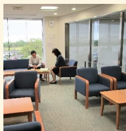
休憩可能なフリースペース