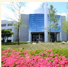
ひたちなかテクノセンター

事務作業で必要となるパソコンや周辺機器の取り扱いを学習するとともに、文書作成（ワード）、表計算（エクセル）、プレゼンテーション（パワーポイント）、セキュリティ、電子メールによる情報通信等を習得します。