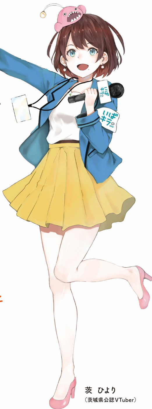
茨 ひより (茨城県公認VTuber)