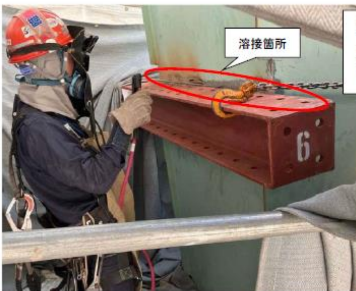
溶接作業時の状況（作業姿勢の再現）