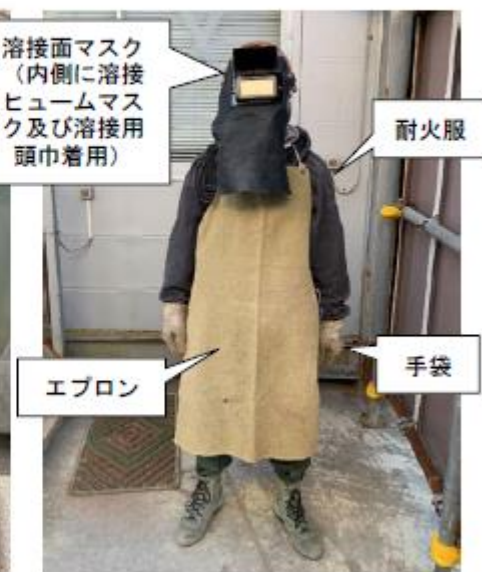
溶接作業時の服装（着衣イメージ）