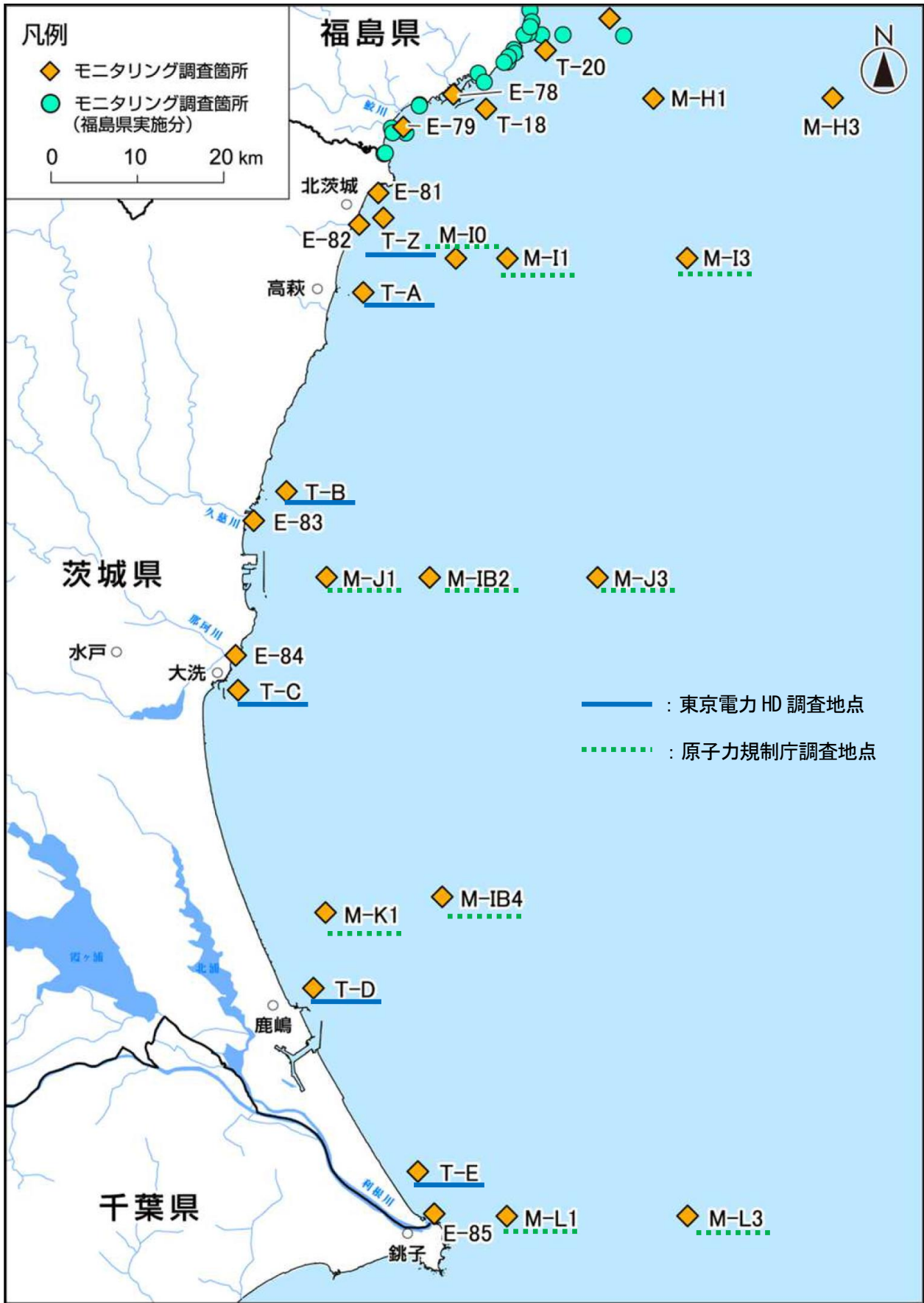
図Ⅱ-2 茨城県沖合の海域モニタリング地点 (海域モニタリングの進め方)