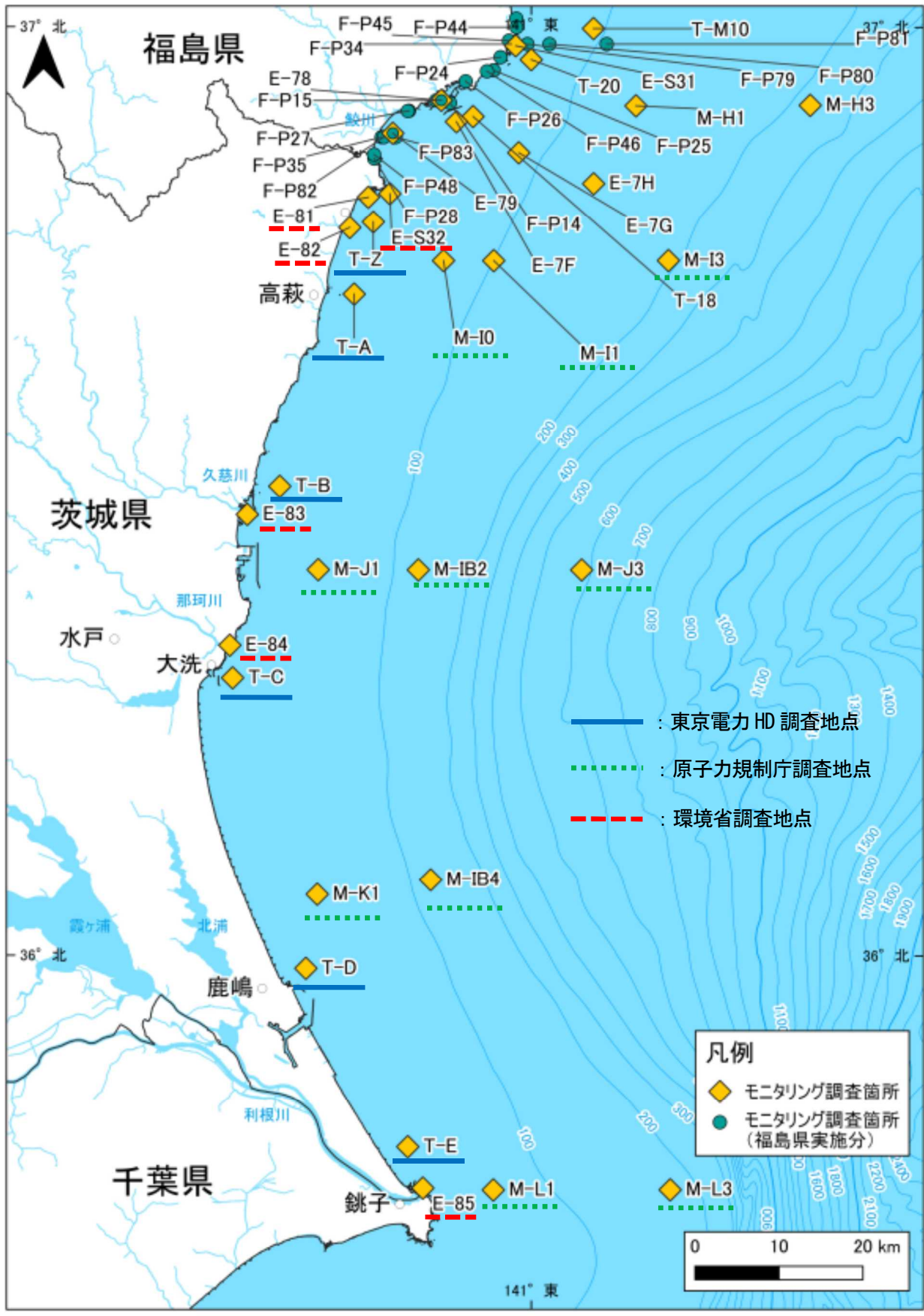
図Ⅱ-2 茨城県沖合の海域モニタリング地点 (海域モニタリングの進め方)