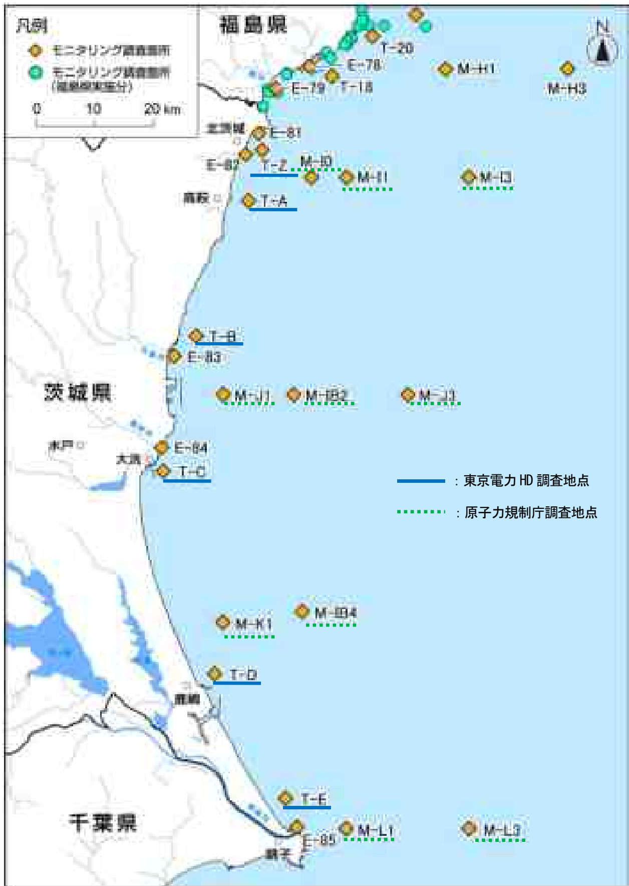
図Ⅱ-2 茨城県沖合の海域モニタリング地点 (海域モニタリングの進め方 出典：原子力規制庁)