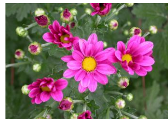
「常陸サマールージュ」の開花状況