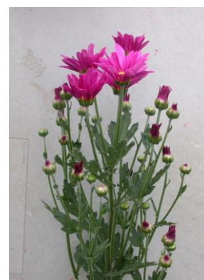
「常陸サマールージュ」草姿