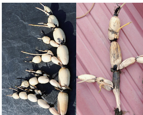
写真1 レンコンの正常個体（左）と形状不良個体（右、DNAを調査した結果、異品種と判明）