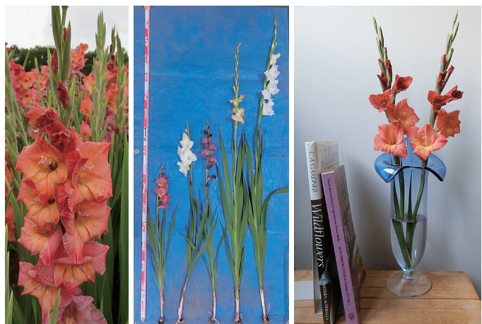
写真2 「ひたち13号」の花姿、草姿 及び使用のイメージ