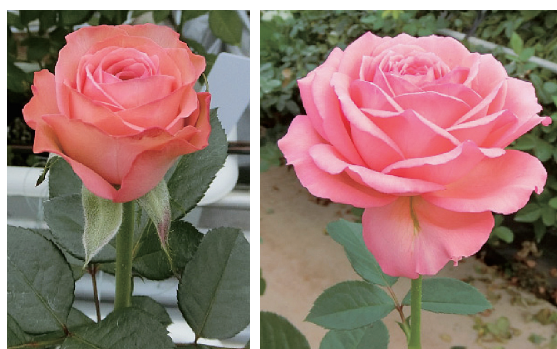
写真2 「ひたち2号」の花姿と草姿