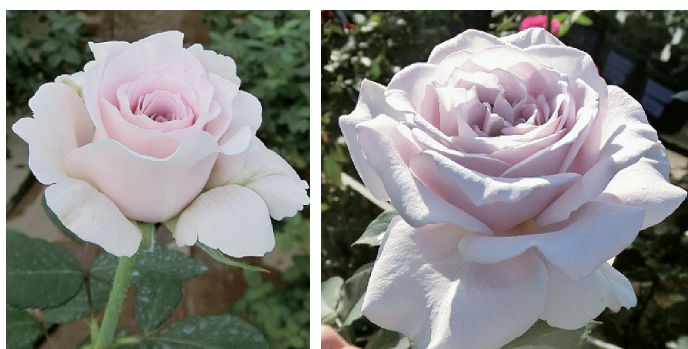
写真1 「ひたち1号」の花姿と草姿