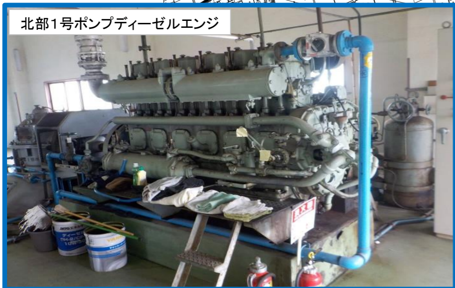
北部1号ポンプディーゼルエンジ

老朽化による劣化が著しい、ポンプ及びディーゼルエンジンの更新を行い湛水被害を防止する。