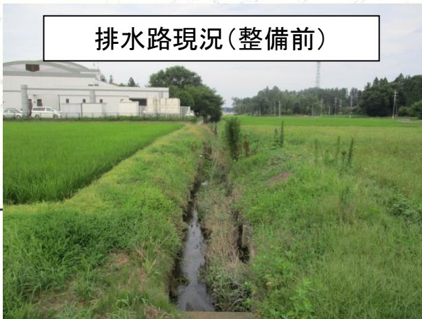
排水路現況(整備前)