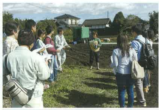
現地見学ツアーの様子

い仲間が加わったときは、暖かい支援・応援をいただければと思います。声をかけていたただくだけでも、新規就農者にとって大きな励みになります。