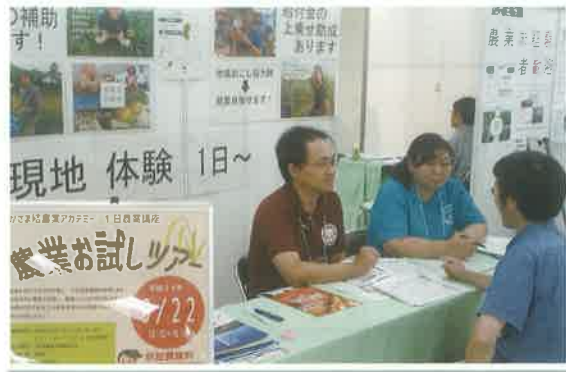
就農相談会（東京）の様子

笠間地域就農支援協議会（P.4参照）では、より多くの新規就農者を確保できるよう、新しい取り組みをすすめています。近年では、東京で開かれる全国規模の就農相談会に出展し、県外からの移住者を迎え入れるなど、成果も出てきています。