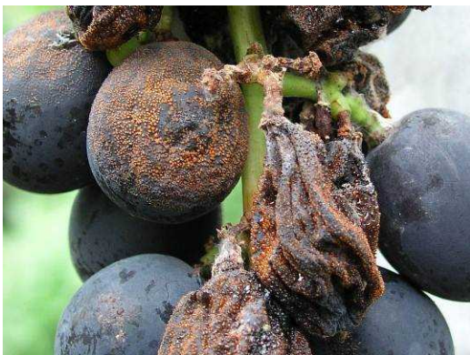
写真 晩腐病による被害果実

防除対策 落葉は集めて土中深く埋めるとともに、結果母枝等は剪定時に取り除き、適切に処分する。