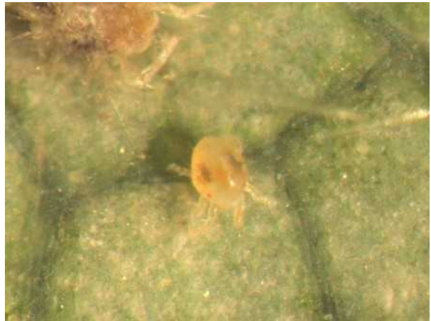
写真2 ナミハダニ幼虫(体長 0.2mm 位)