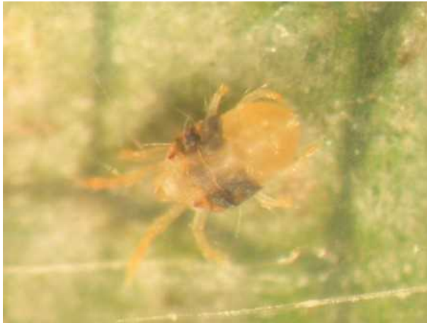
写真1 ナミハダニ雌成虫(体長 0.6mm 位)