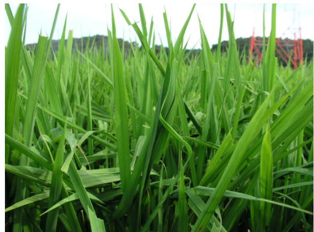
写真 2 イネツトムシ幼虫による被害（ツト）