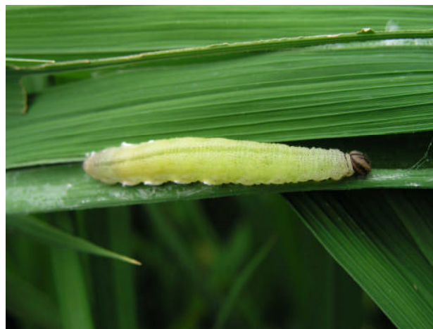
写真 3 イネツトムシ老齢幼虫