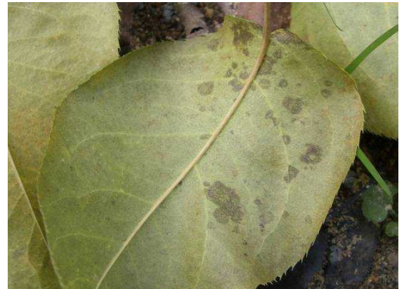
写真 ナシ黒星病の秋型病斑