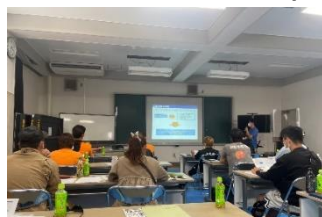
土づくり講座 (R4年度)