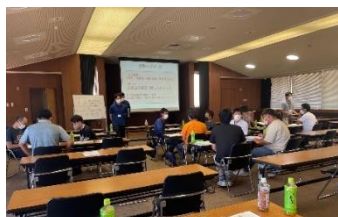
病害虫・農薬講座 (R4年度)