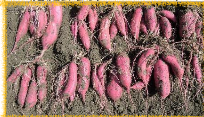
品種比較(シルクスイート)