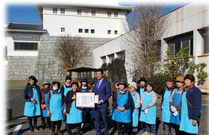
常総市長と直売所会員のみなさん

石下農産物直売所は、令和4年度茨城県表彰において、農村女性による消費者交流促進、地産地消の活性化の功績団体として表彰されました。