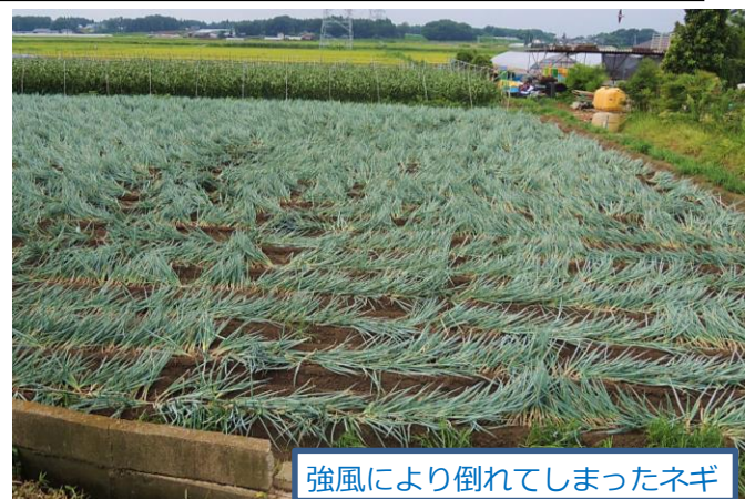
強風により倒れてしまったネギ