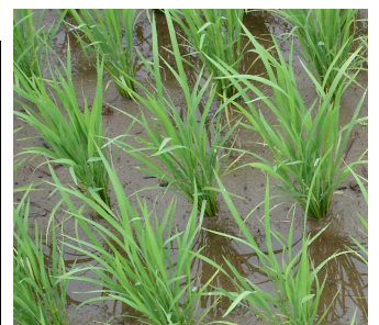
写真: 中干し適期の コシヒカリ 茎数 20本/株程度 (18.5株/m 2 )