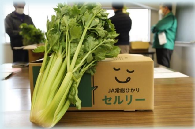
写真：出荷されるセロリ

セロリは栽培が難しいとされている品目ですが、栽培講習会や目ぞろえ会等を開催しながら、栽培に取り組んでいます。また、生産者とJA職員で協力しながら、出荷調整や出荷方法を工夫しています。