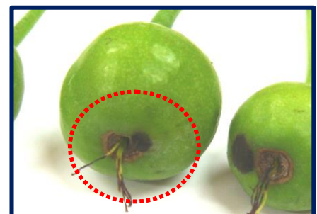
写真 果実ていあ部に発生した黒星