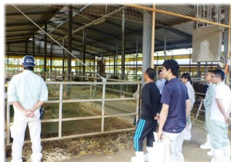
←) 牛舎の見学 ↓) 意見交換会

見学の後は受講生各自で、ワークシートに経営状況や目標、悩みを記入し、意見交換会を行いました。ほ場の水はけの改善や、労働力の確保について等、参加者同士共通の悩みが多く、就農年数の長い学園生が今年就農した学園生にアドバイスを送るなど、積極的な交流がみられました。