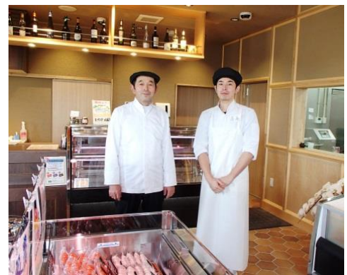
下妻市谷田部石橋 1264 - 3 営業時間 / 11:00~19:00 定休日 / 月曜日

倉持氏は、アミノ酸含量の多い種豚の改良や、下妻産の飼料用米と独自の配合飼料の給餌、定期的に食味分析を行うなどこだわりをもち、おいしい豚肉の生産を心がけています。こうして生産された豚肉は、一般の三元豚よりも旨味・甘味・風味が優れ、さっぱりとして豚肉特有の臭いの少ない特徴があり、「伝説の下妻金豚」として販売しています。また、ベーコンやソーセージ、ハムにもこの豚肉を使用し、約50種もの商品を提供しています