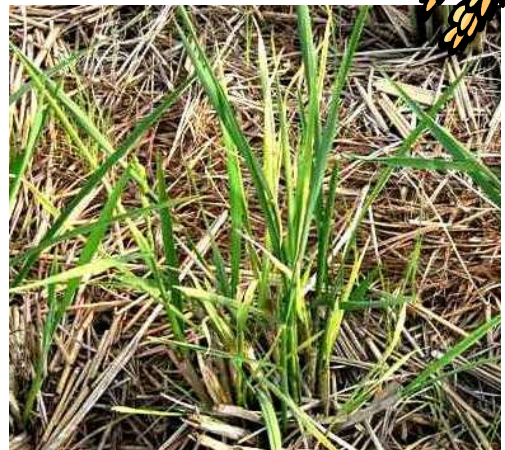
発病したヒコバエ

ひこばえや畦畔等のイネ科雑草はヒメトビウンカの越冬場所となり、放置しておくと、保毒虫率(ウィルスを持つヒメトビウンカの割合)が高まる原因となり、次年度の多発生を助長する恐れがあります。ヒメトビウンカの越冬場所を出来るだけ少なくするためにも、収穫後の秋耕や畦畔除草をしっかり行いましょう。