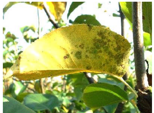
黒星病の秋型病斑

秋病斑を生じた葉からは、落葉するまで、降雨によって黒星病菌が広がります。最低限80%落葉時まで秋季防除を徹底しましょう。特に徒長枝の先端まで十分量の薬液がかかることが重要です。今年被害が多かったほ場はもちろん、発病の少なかったほ場でも油断せずに防除を行い、来年に備えましょう。