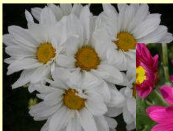
常陸サマースノウ