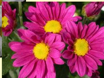
常陸サマールビー

コギクには赤色・白色・黄色を中心として多くの品種があります。茨城県では，茨城県生物工学研究所が育成したコギク品種が12品種あり，県内各産地で作付けされています。当地の筑西市・桜川市・下妻市でも，もちろん作付けがされています。8月お盆には『常陸サマースノウ』（白色），『常陸サマールビー』（赤色）が出荷予定です。