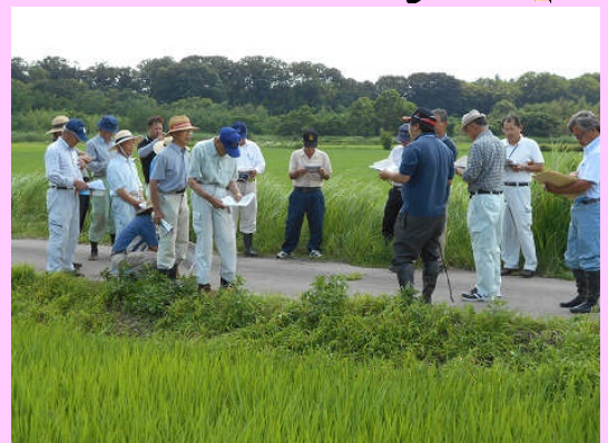
現地ほ場で講習会を実施しました！